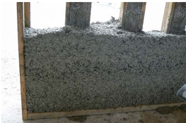
ossature bois noyée dans béton de chanvre

art de la chaux est une entreprise artisanale qui s'inscrit dans une démarche de développement durable.